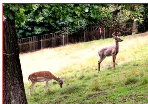
FRANCOUZSKÝ PARK CCA 40 MIN.

Prohlídka zámku zahrnuje povídání o životě na zámku, pánské a dámské salóny i krásný Zrcadlový sál.