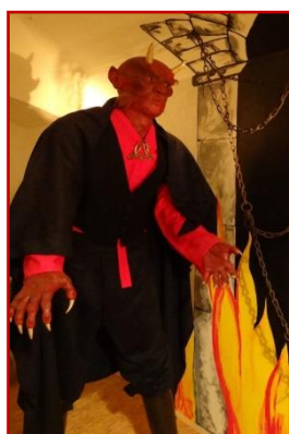
DOBŘÍŠSKÉ PŘÍZRAKY 20 MIN.