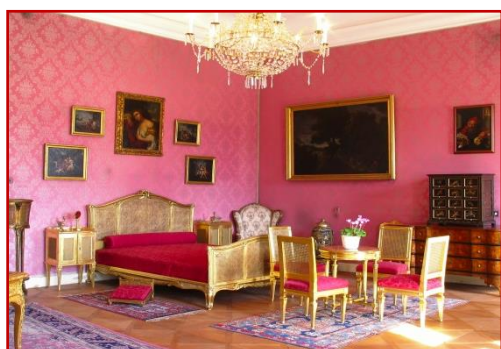
ZÁMECKÁ EXPOZICE 30 MIN.

BALÍČEK 1 MATEŘSKÁ ŠKOLA 60 Kč I. STUPEŇ ZŠ 90 Kč