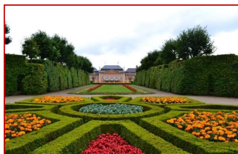
FRANCOUZSKÝ PARK CCA 40 MIN.

Prohlídka zámku zahrnuje povídání o historii zámku a majitelů, Domově spisovatelů, pánské a dámské salóny a reprezentační sály včetně zrcadlového sálu.