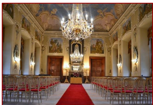
ZÁMECKÁ EXPOZICE 60 MIN.